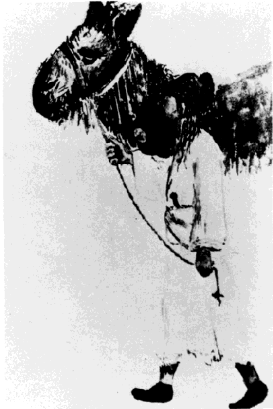
A. Hitler, Aquarell Kamel mit Führer