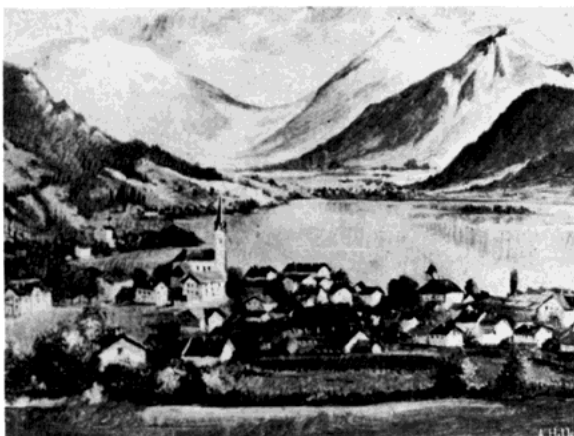
A. Hitler, Aquarell Landschaft

Hitler hatte ästhetisch nichts riskiert und jede Art von Irritation ausgeschlossen, sei es dank Nicht-Wahrnehmung oder Verbot, ja Vernichtung. Aber: Irritation ist nun einmal das Stichwort für die Kunst des 20. Jahrhunderts und alle Präfaschismen waren trotz des totalitären Hitlerismus nicht mehr zukunftsstiftend. Hoffentlich.