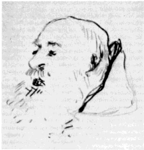
Adolf Hitler, Zeichnung, Porträt eines Mönches der Klosterschule Lambach

Hitlers Unfähigkeit, den Lehrangeboten auf den